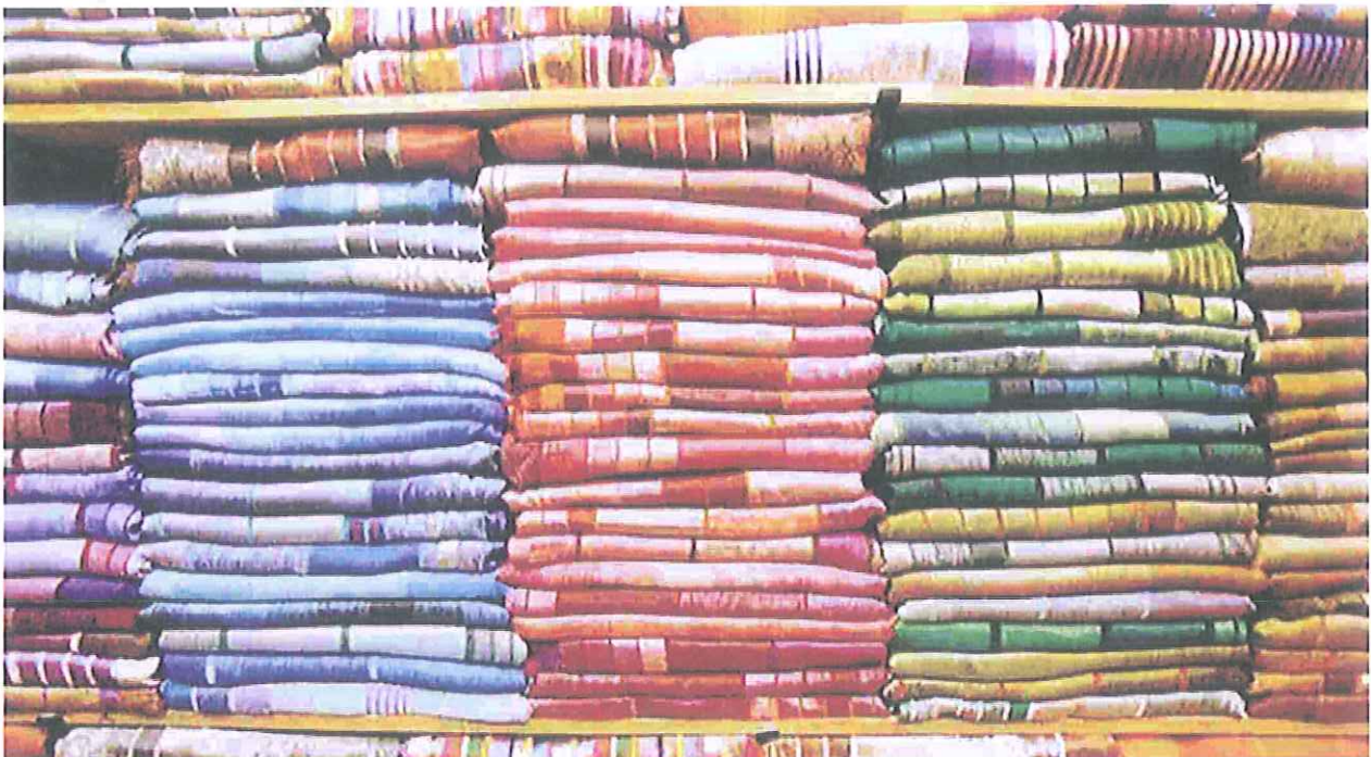
Il settore tessile in provincia di Varese nel primo trimestre del 2015 ha perso quasi quattro punti percentuali: è il dato peggiore