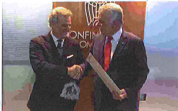
Il primo ministro del Quebec, Philippe Couillard con Alberto Ribolla

«L'incontro nasce con l'obiettivo di intensificare le relazioni commerciali tra Lombardia e la provincia del Québec. Il recente accordo economico-commerciale UE-Canada e i progetti presentati dal Primo Ministro Couillard, infatti, rappresentano per le nostre imprese una grande opportunità di investimento e sviluppo. Inoltre, il know-how, le competenze e l'innovazione possedute dalle imprese lombarde si innestano alla perfezione nel quadro dell'intesa su Ricerca e Innovazione siglata nel settembre 2015 tra Regione Lombardia e Québec. Questo consentirà a numerose PMI lombarde, anche attraverso i cluster tecnologici - come già avviene tra il Lombardy Energy Cleantech Cluster e l'Ecotech Québec nell'ambito della collaborazione avviata nel 2010 -, di instaurare partnership proficue con la provincia canadese. L'intesa bilaterale prevede collaborazioni nel manifatturiero avanzato applicato ai settori dell'aerospazio, dell'agroalimentare e della micro e nanoelettronica, tutti settori di eccellenza delle nostre imprese. Confindustria Lombardia, nell'ambito del progetto Internazionalizzazione contenuto nel piano strategico #Lombardia2030, supporterà le imprese lungo questo percorso di apertura verso nuovi mercati» ha aggiunto il presidente di Confindustria Lombardia, Alberto Ribolla .