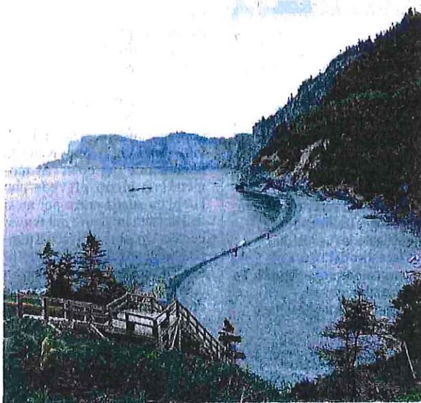
Fiume San Lorenzo. La sua portata media è circa 9 volte quella del Po