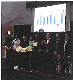
Gli studenti premiati