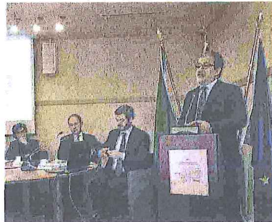
PRESIDENTE Roberto Maroni ieri a Bruxelles