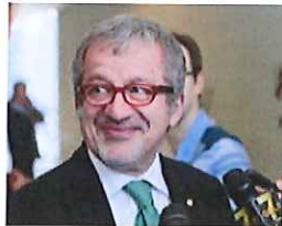
Maroni: a maggio in area Expo prima Davos della manifattura 4.0

asknews Da Asa | Askanews – 15 minuti fa