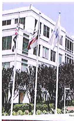
La sede di Apple a Cupertino

Nel tour la delegazione toccherà con mano il business e l'innovazione made in Usa, per comprendere al meglio i segreti e i fattori che rendono possibile il successo di startup, imprese e