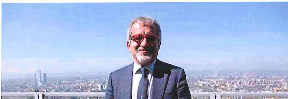
Roberto Maroni