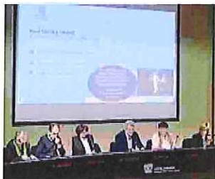
Un convegno per il futuro

«Per competere nei mercati globali c'è bisogno di una pianificazione di lungo periodo, oltre che di forti partnership con tutti gli stakeholder. Per questo lanciamo #Lombardia2030, perché la competitività del domani dipende dalle scelte che facciamo nell'oggi, tenendo sempre presente da dove