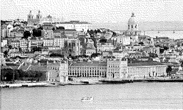
Lisbon - old quarters near river Tagus

Milano – Confindustria Lombardia ha incontrato oggi, presso la sede di Milano, una delegazione istituzionale e imprenditoriale del Portogallo. A capo della delegazione il Segretario di Stato per l'Industria portoghese Joao Vasconcelos e Antonio Saraiva, Presidente di CIP – Confederacao industria Portugal, la Confindustria portoghese. La missione si è aperta con un confronto tra la delegazione e il presidente di Confindustria Lombardia Alberto Ribolla focalizzato sull'incremento delle sinergie e