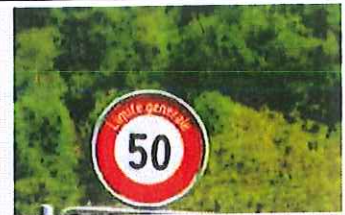
Svizzera: nuovo autovelox lungo la strada per Livigno