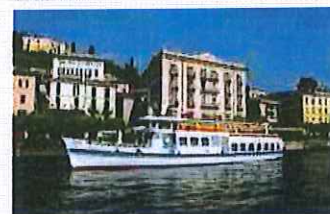
Navigazione Lago di Como: battelli serali in centro lago