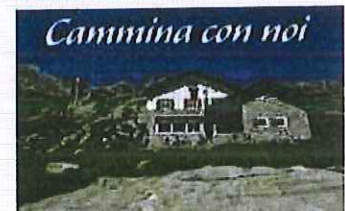
La salita al Rifugio Omio alla scoperta della Valle dell'Oro