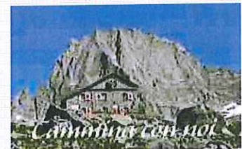
Salendo al rifugio Gianetti tra le meraviglie della Val Masino