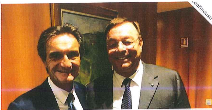
Publicato il luglio 12th, 2019 | Da Redazione Russia News