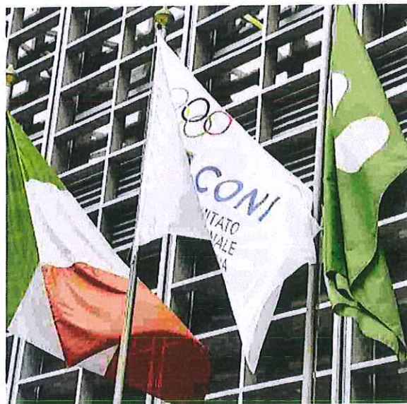
Il sogno olimpico diventato realtà fa sperare anche gli industriali

Ieri nella sede di Milano faccia a faccia con Fontana per discutere di vari temi tra cui la sfida olimpica