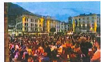
Sondrio Estate la città tra magia, musica e cultura