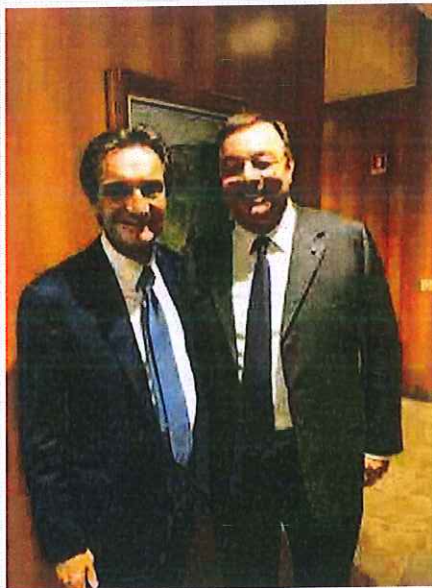
a sinistra Attilio Fontana e Bonometti

Confronto fra i vertici degli industriali e il governatore Attilio Fontana su Autonomia, infrastrutture e Olimpiadi