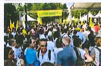
Coldiretti grande successo del villaggio contadino a Milano