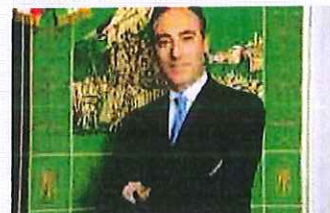
Proroga al 30 settembre per il rinnovo delle esenzioni sanitarie non automatiche