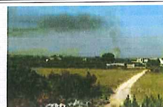
Commissione ecomafia in missione a Marzano Comense