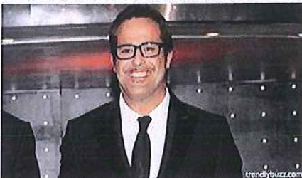
Second Marco, "Tutti Dovrebbero Cogliere Questa Opportunita"