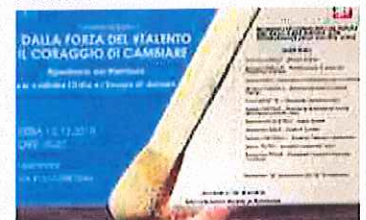
Forza Italia Como e Lecco, incontro pubblico in vista delle elezioni amministrative ed europee