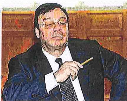
AI VERTICI Marco Bonometti, presidente di Confindustria Lombardia

lenze locali, non fa leggi, non distribuisce fondi, ma aiuta a spendere e lavorare in modo mirato ed efficiente». «Un metodo - aggiunge Bonometti - che ha già dato rilevanti frutti in tema di innovazione e di mobilità sostenibile e che si traduce in una occasione di scambio e alleanze concrete fra aziende di differenti territori». Una delle sfide della presidenza lombarda sarà, secondo il presidente degli industria-