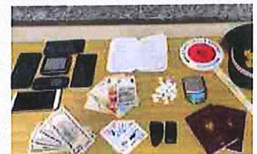
Cassano Magnago spaccio nei boschi droga nascosta nel "captello".