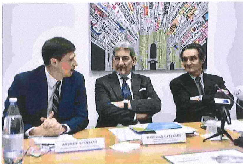
La presentazione del progetto con il presidente Fontana e l'assessore Cattaneo

MILANO - Milano capitale. Niente a che vedere con le richieste d'autonomia, né tantomeno con rinnovati spiriti secessionisti, quanto piuttosto con la presidenza di Eusalp. La Lombardia domani prenderà la guida della Strategia macroregionale alpina e fino al prossimo anno farà da punto di riferimento per tutti gli enti territoriali uniti dal patto di Grenoble. Era il giugno 2013 quando nella città francese quarantotto realtà provenienti da Italia, Francia, Germania, Austria, Slovenia, Liechtenstein e Svizzera misero in comune tre obiettivi fondamentali: sviluppare le regioni all'ombra delle Alpi, connetterle tra loro e proteggerle promuovendo una gestione sostenibile dell'energia e delle risorse naturali. A Palazzo Lombardia, per il simbolico passaggio di consegne presidenziali con il Tirolo, saranno presenti anche il ministro per gli Affari regionali e per le Autonomie Erika Stefani e il titolare dell'Istruzione Marco Bussetti. «Eusalp - ha affermato ieri