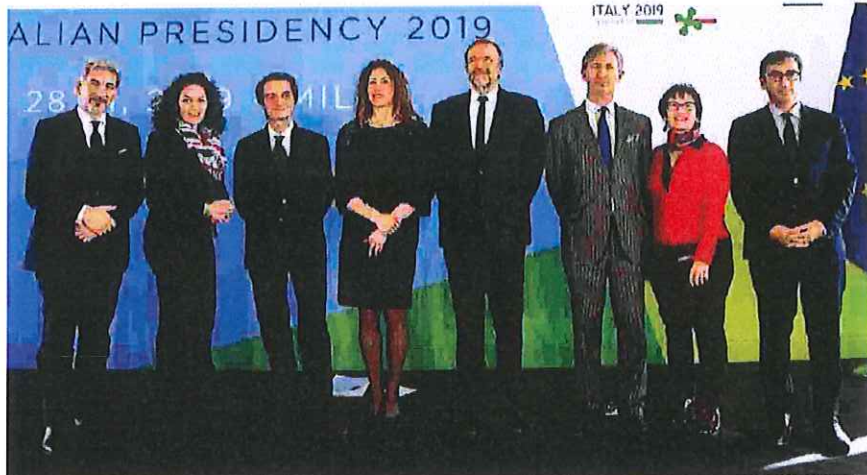
A Palazzo Lombardia il 28 febbraio si è svolto il passaggio di consegne ufficiale tra il Tirolo e la nostra regione

«Ci ha fatto molto piacere il messaggio del presidente Mattarella - ha continuato Fontana - perché lascia intendere come anche lui stesso guardi con attenzione a questa strategia. Così come