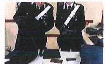
Castellanza esce di casa e rapina il supermercato