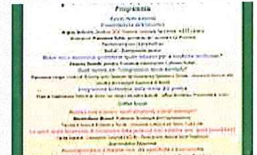
Malattie rare esperti a confronto sull'integrazione socio-sanitaria