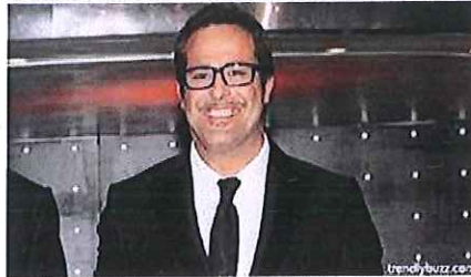
Second Marco, "Tutti Dovrebbero Cogliere Questa Opportunita"