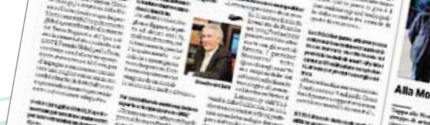
Sostenibilità: i carburanti fossili restano il problema