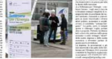
La Settimana per l'Energia scalda i motori