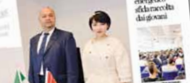
Risparmio energetico sfida raccolta dai giovani