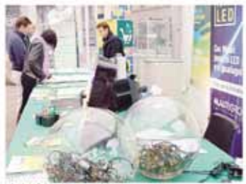
Stando all'ordine della settimana per l'energia