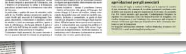
Salute, via Torretta pensa anche alla prevenzione