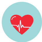
SCIENZE DELLA VITA