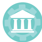
TECNOLOGIE PER IL PATRIMONIO CULTURALE