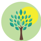
AMBIENTE ED ENERGIA