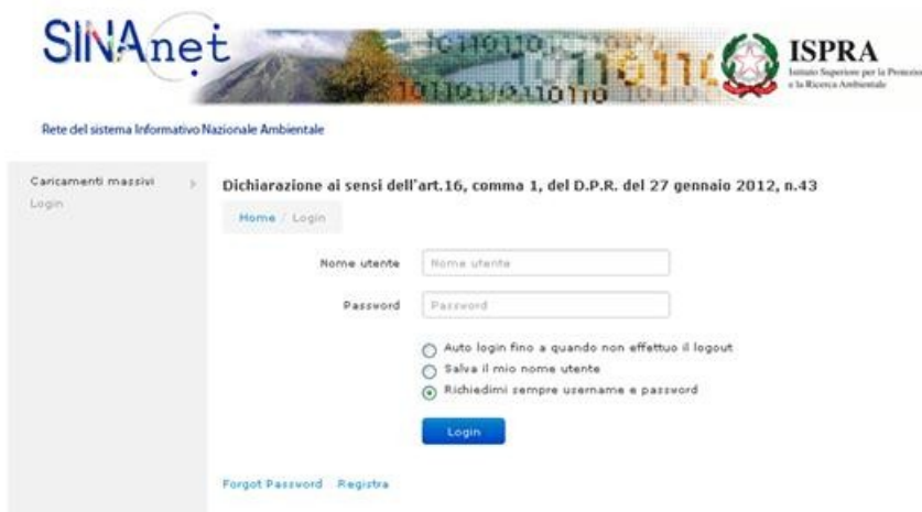
Figura 1. La pagina per accedere al sistema e per eseguire la registrazione degli utenti.

Il sistema visualizza la pagina di "login" vedi Figura 1.